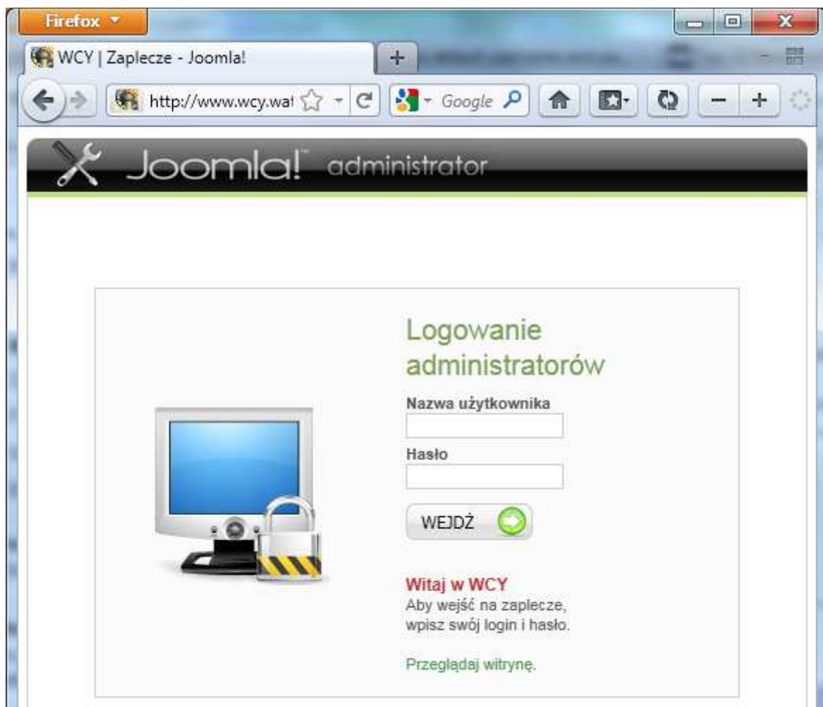
Rys.1. Formularz logowania do http://www.wcy.wat.edu.pl/administrator/

Do przeprowadzenia ataku wybrałem formularz logowania do panelu administracyjnego strony http://www.wcy.wat.edu.pl . Formularz logowania znajduje się pod adresem: http://www.wcy.wat.edu.pl/administrator/ . Systemem CMS do zarządzania treścią w/w strony internetowej Wydziału Cybernetyki jest najprawdopodobniej Joomla™. Użyłem słowa „najprawdopodobniej”, ponieważ struktura panelu Joomla™ może być jedynie czymś w rodzaju „honey pot-a”. Korzystając więc z ogólnodostępnych informacji w Internecie można dowiedzieć się, że domyślna nazwa użytkownika dla administratora CMS Joomla™ to admin 1 . Zakładając, że człowiek instalujący w/w system był na tyle leniwy, że zaakceptował domyślną propozycję systemu możemy rozpocząć atak przyjmując, że nazwa użytkownika jest już nam znana. Nie daje nam to jednak żadnej pewności.